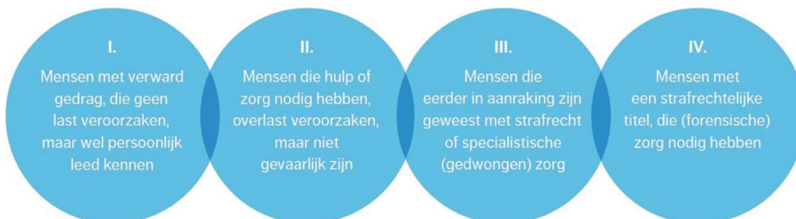
Figuur 1 Doelgroepen verward gedrag

Verward gedrag is dus niet altijd het gevolg van een psychiatrische stoornis. Ook mensen zonder zo'n stoornis kunnen 'verward' raken, door bijvoorbeeld alcohol- of middelengebruik, een traumatische gebeurtenis, een verstandelijke beperking of (beginnende) dementie of (een cumulatie) van traumatische, psychosociale ervaringen. Bij dit plan van aanpak richten we ons op het bereiken van de 4 doelgroepen zoals het Aanjaagteam deze heeft gedefinieerd. We richten ons bewust niet alleen op degenen die zware overlast of crimineel gedrag aan de dag leggen maar op de brede doelgroep.